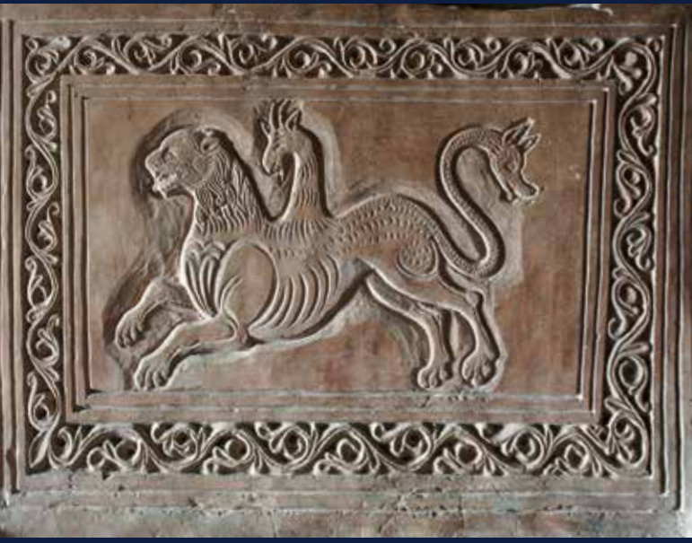
Complesso abbaziale di San Pietro al Monte