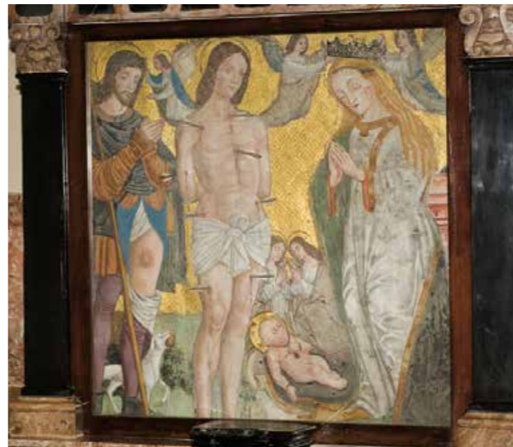
Chiesa di San Martino di Carella

Chiesa di Sant'Isidoro, Sasso di Preguda Chiesa di San Tomaso, Orto botanico (piante officinali, aromatiche e flora spontanea al Centro Culturale Fatebenefratelli)