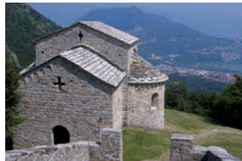
Oratorio di San Benedetto al Monte