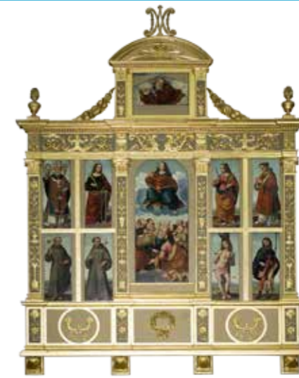
Chiesa di Santa Eufemia e battistero di Oggiono

All'interno si notano gli affreschi: Madonna con Bambino in trono tra S. Eufemia e S. Caterina d'Alessandria (attribuito a Marco d'Oggiono, allievo di Leonardo da Vinci), Sposalizio della Beata Vergine e di San Giuseppe (Andrea Appiani), oltre ad un organo settecentesco dei fratelli Serassi. Tra i più significativi monumenti del romanico lombardo, il Battistero di S. Giovanni Battista. I resti e gli scavi condotti dal 1997 al 1999 hanno messo in luce due fasi precedenti: un primo battistero a pianta quadrata, del V-VI secolo, un secondo con più absidi, infine la costruzione attuale dell'XI secolo che presenta la caratteristica pianta ottagonale con absidi sporgenti. Caratteristici gli affreschi appartenenti alla