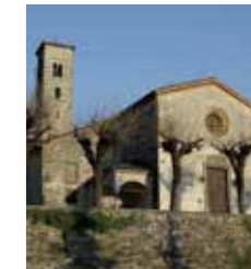
Chiesa di San Giorgio

dotato di due ante richiudibili ad armadio. Nella cappella maggiore un ciclo di affreschi raffigura il Padre Eterno attorniato dagli Evangelisti mentre veglia dall'alto dei cieli; è datato tra il 1496-1501 ed è attribuito al grande Maestro della Pala Sforzesca che lavorò per Ludovico il Moro.