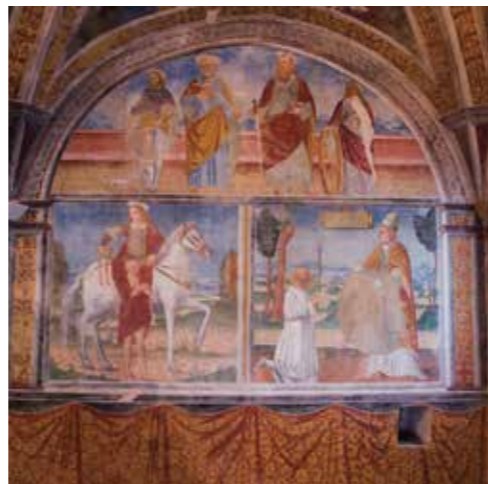
Santuario della Madonna di San Martino di Valmadrera

sopra un promontorio affacciato sulla destra del torrente Inferno. Costruita nell'Alto Medioevo, aveva originariamente funzioni di avvistamento. Alla fine del XIII secolo fu trasformata in luogo di culto. All'interno