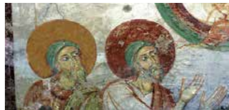
Complesso di San Calocero

Ai piedi dello scalone di accesso alla Basilica, si trova l'oratorio di San Benedetto. All'interno della architettura trilobata restano tracce di affreschi seicenteschi e un piccolo altare dell'XI secolo magnificamente decorato su tre lati.