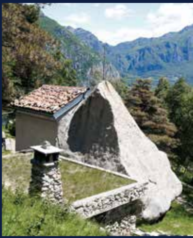
Sasso di Preguda a cui è addossata la Chiesa di Sant'Isidoro